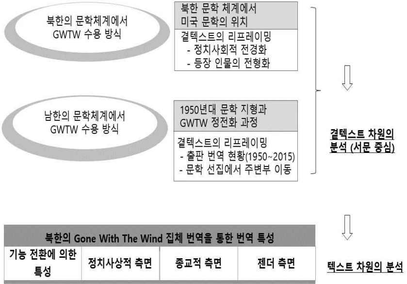
그림 1. 연구 방법 및 절차